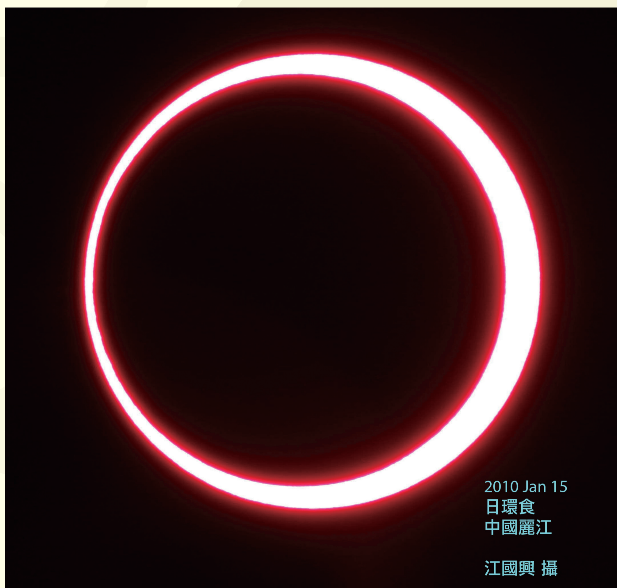
2010 Jan 15 日環食 中國麗江