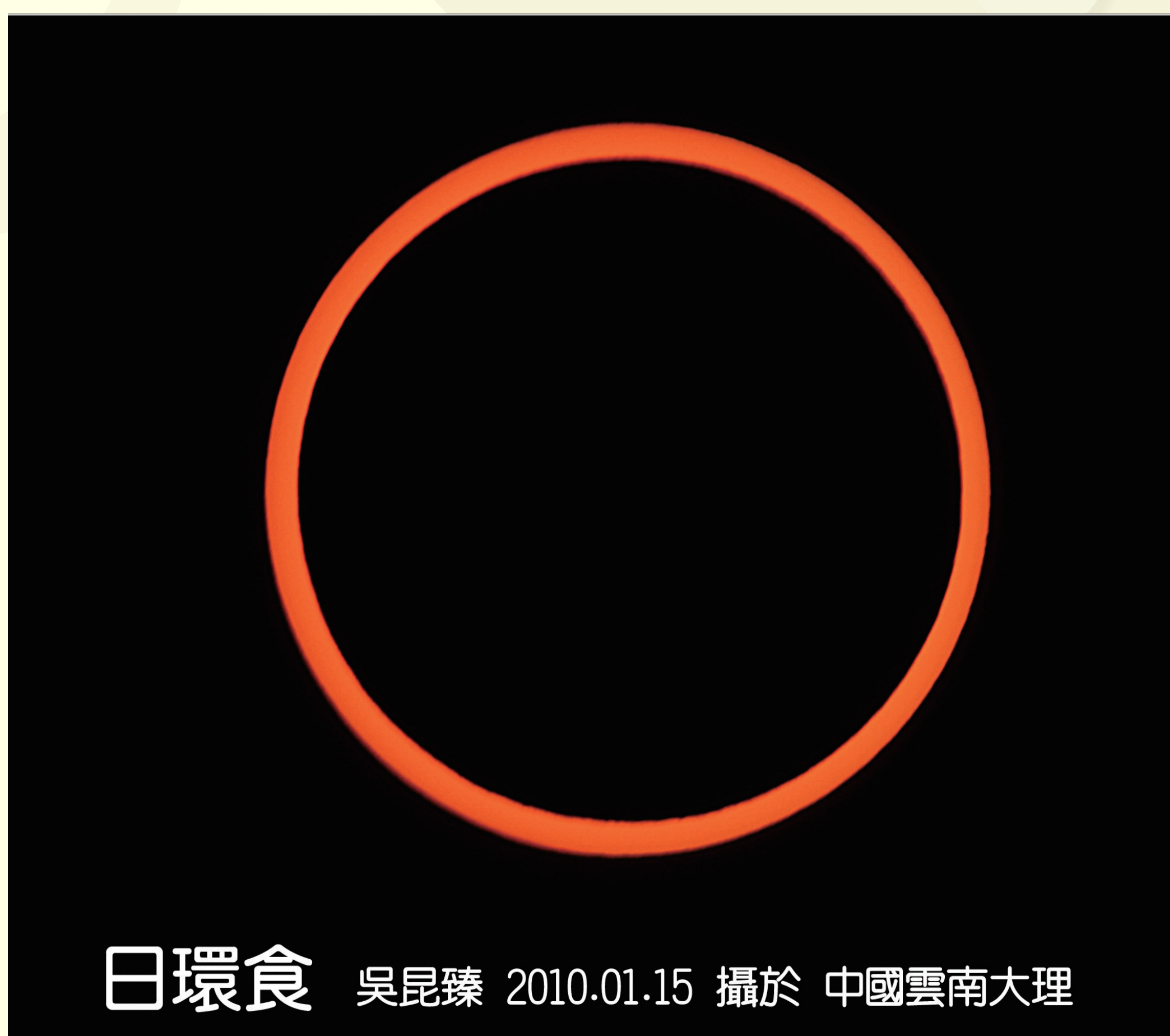
日環食 2010.01.15 攝於 中國雲南大理